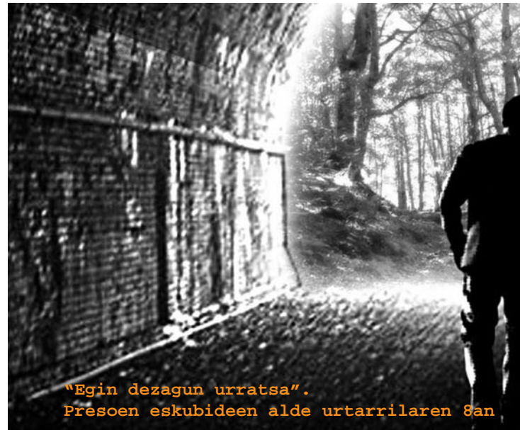
“Egin dezagun urratsa”. Presoen eskubideen alde urtarilaren 8an

Badirudi batzuentzat Presoen Kolektibotik aparte egiten bada damutze politikoa dela. Beraz, Kolektibo hori, Batasunak eta Etxeratak bezala, Gernikako Akordioaren estrategian erori da, eta bat egingo duenean damutze