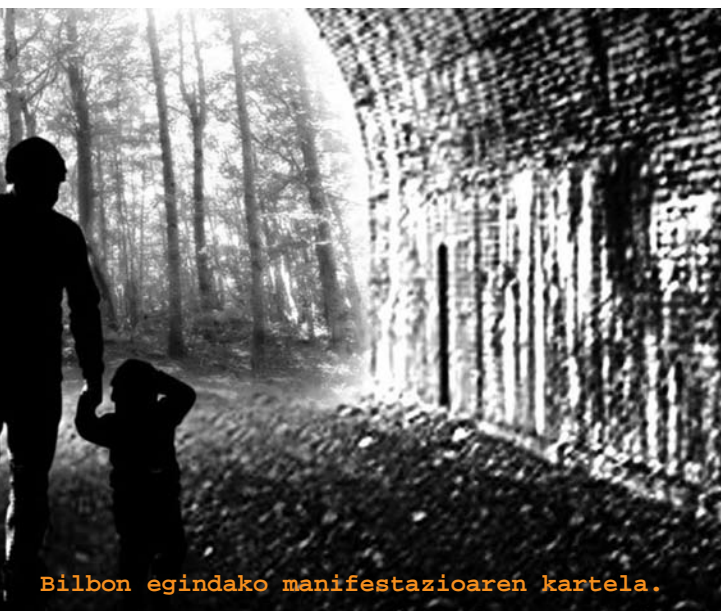
Bilbon egindako manifestazioaren kartela.

ez ziren espetxetik aterako. Hori bai, berak defenditu dituenek, espetxean 15, 20 edo 25 urte egin eta gero ezin dute baimen ziztrin bat eskatu.